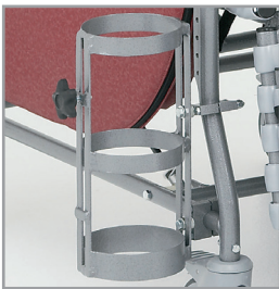
Porte- bouteille d'oxygène