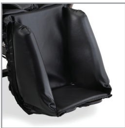
boîte à pied