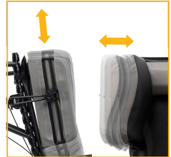
Le fauteuil est pourvu d'appuis latéraux réglables pour convenir à toute une variété d'utilisateurs.