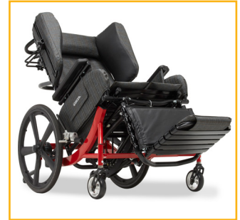
L'inclinaison du siège à pivot avant maintient une de vue vers l'avant, favorisant l'interaction sociale / l'échange