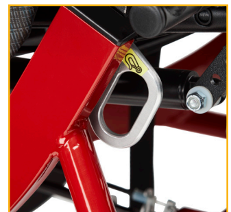
Le pack de transport WC-19 en option permet un voyage sécurisé du patient