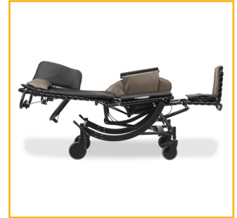
Le mécanisme d'inclinaison facilite le repositionnement des utilisateurs