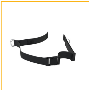
Pelvic Positioning Strap