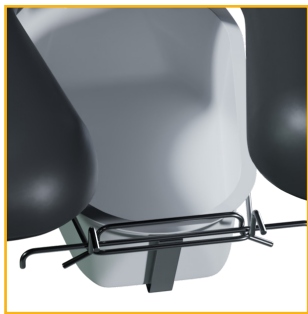
Commode pan with Basket