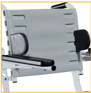
Molded Lateral Supports