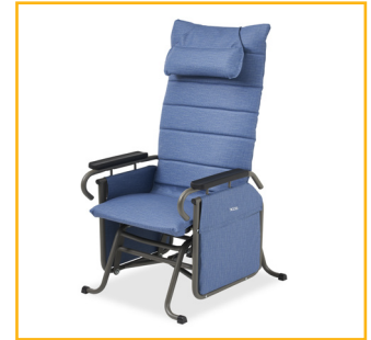
Stimule les patients actifs et réduit le besoin d'errer