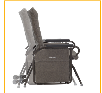
Mouvement de glissement doux